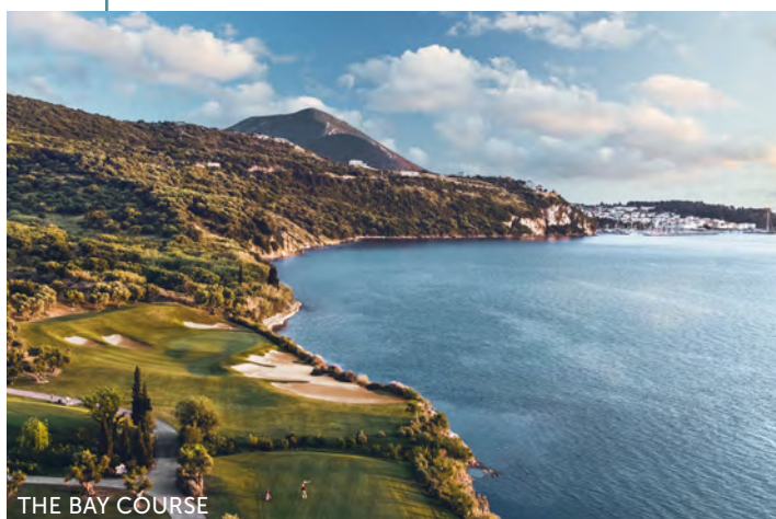
THE BAY COURSE

Erleben Sie an Bord der neuen Luxus-Yacht Emerald Azzurra die schönsten Inseln Griechenlands und die türkischen Hotspots Bodrum und Kusadasi. Erholung und Verwöhnung stehen während der Kreuzfahrt im Vordergrund und im Anschluss haben Sie die Möglichkeit, in der beliebten Golf-Destination Costa Navarino für einen Golfurlaub zu verlängern.