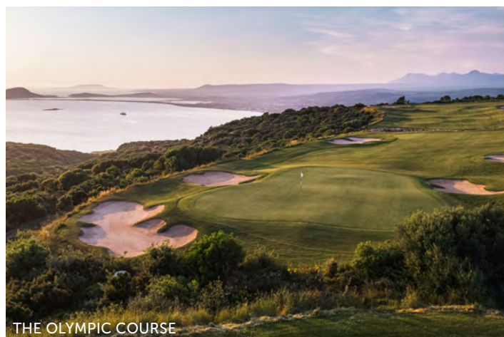
THE OLYMPIC COURSE

Costa Navarino hat sich als Golf-Destination in den letzten Jahren einen exzellenten Namen gemacht. Seit neuestem warten hier insgesamt vier großartige Golfplätze auf Sie. Das wahre Highlight sind die mittlerweile vier 18-Loch-Golfplätze innerhalb von wenigen Kilometern. Die beiden „älteren“ Plätze The Dunes von Bernhard Langer und The Bay Robert Trent Jones Jr. bieten schon genug Herausforderungen, um sie mehrmals zu meistern. The Olympic und The Hills befinden sich rund 20 Minuten vom Hotel entfernt und sind aus der Feder von José Maria Olazabal.